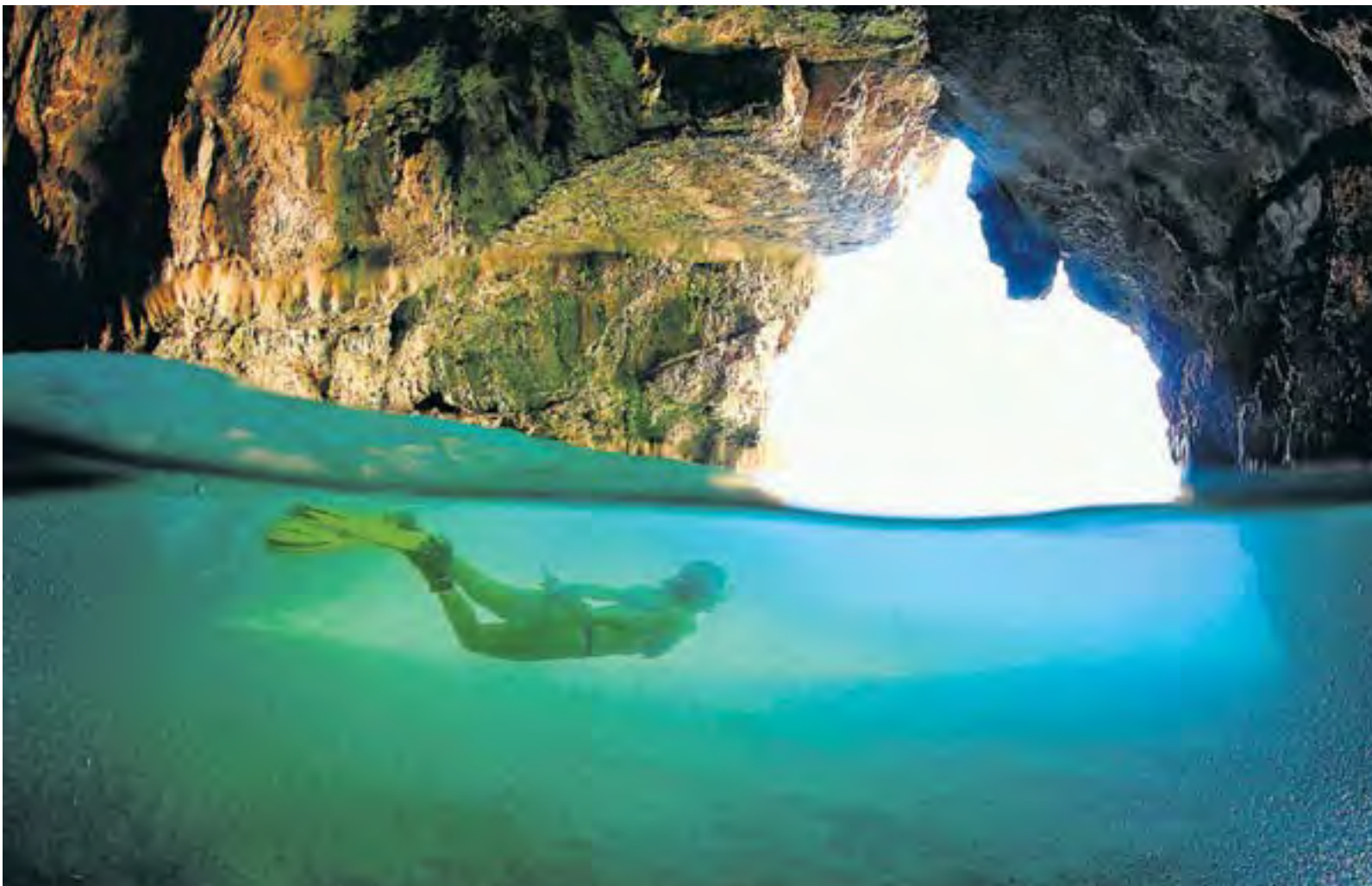
Arribar fent surf de rem o caiac fins a la cova del Llop Marí de l'Hospitalet de l'Infant i submergir-te sota les seves aigües tot practicant snorkel és una de les moltes propostes aquàtiques que es poden fer al llarg de la Costa Daurada.