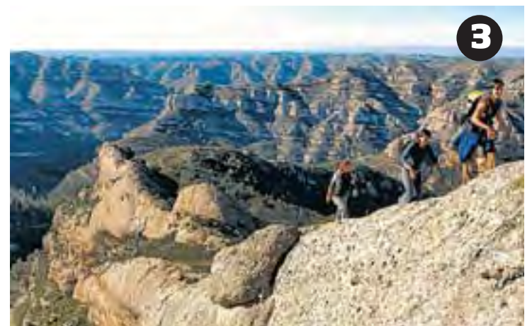
El cicloturisme (1) i el senderisme (3) són activitats destacades a la Costa Daurada. El patrimoni històric (2) és un altre dels atractius.