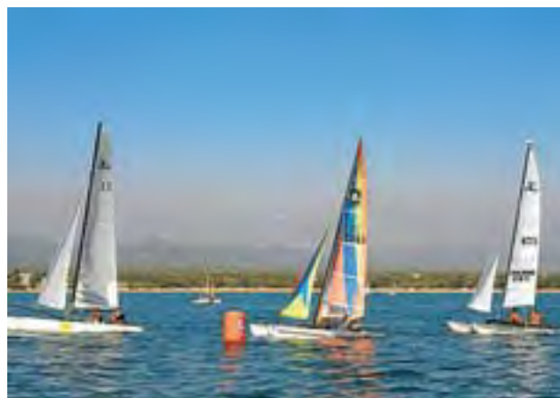
Recórrer el litoral des dels ports de la Costa Daurada és una proposta interessant.

Una experiència per a tota la família pot ser practicar la pesca esportiva des d'una embarcació a motor acompanyat per un monitor.