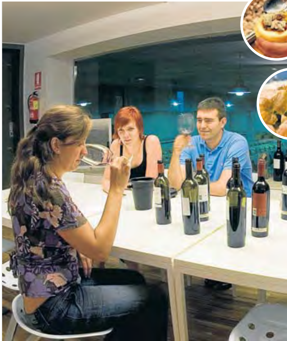
El tast de vins és una de les experiències més populars i es pot fer en els mateixos cellers. L'arrossejat i la clotxa són plats típics de la Costa Daurada.

D egustar un bon plat és d'aquelles coses que recordes quan tornes a casa després de fer un viatge. A la Costa Daurada, la riquesa i varietat gastronòmiques són un dels elements destacats i que capten l'atenció de moltes persones. Així, en un espai geogràfic proper, trobem el xató del Penedès que conviu amb la calçotada de Valls. El bull és un menjar típic de Torredembarra, com la tonyina a l'Hospitalet de l'Infant, i ¿quines millors postres que un menjar blanc de Reus? Hi ha altres plats com la clotxa, que combina com cap altre el producte del mar i la tradició de la muntanya. Un aliment habitual a Vandellòs. També trobem alguns municipis que han fet bandera d'aquesta aposta gastronòmica. És el cas de Cambrils, que està construint una imatge de destinació culinària de primer ordre combinant una excel·lent oferta de